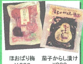
ほおばり梅 茄子からし漬け ¥380 ¥380 (楠むらづくり)