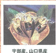
宇部産、山口県産 一夜干し各種(魚千代) ※金額は種類別です