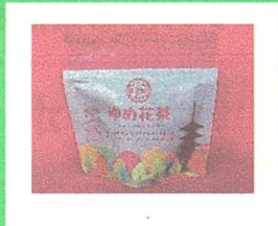
ゆめ花茶(フレーバーティー) 煎茶・ほうじ茶ラテ 各種 (鴻雪園)