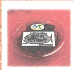
瀬戸内れんちょう (JF新宇部) ¥350