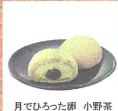
月でひろった卵 小野茶 (あさひ製菓) 1個 ¥200 他