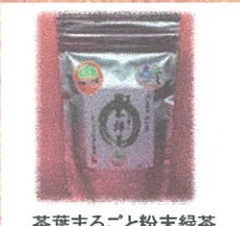
茶葉まるごと粉末緑茶 (JA山口宇部緑茶センター) ¥756