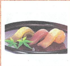
小川の外郎 宇部産緑茶 (小川蜜カス本舗) ¥110/本