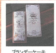
ブランデーケーキ スタンダード (ロイヤル) ¥1,296