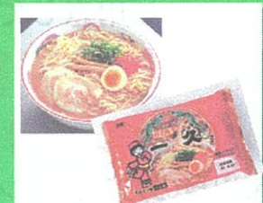
お土産ラーメン(一久食品) 1人前 ¥590