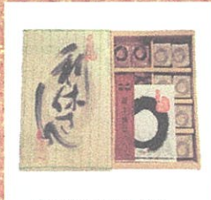
利休さん(吹上堂) 16個入り ¥580 他