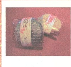
宇部炭部バーグ (ポナベティ) ¥各250