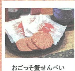
おごっそ蟹せんべい (セルブ南風) 10枚入り ¥600 他