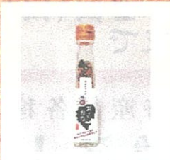
魚ふりかけ(魚千代) ¥540