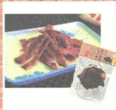
えいひれジャーキー (JF宇部岬) ¥450