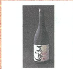
芋焼酎 長州侍 (長州侍) 720mL ¥1,572