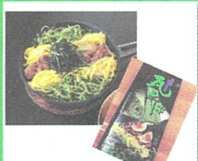
瓦そば(山口茶業) 2人前 ¥1,080