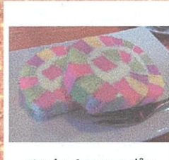
アルカンシエル ルボン (ポナベティ) ¥200