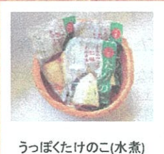
うっぼくたけのこ(水煮) (うべる市民まちづくり) ¥537