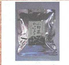
小野茶かりんとう (山口茶業) ¥540