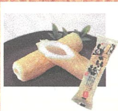
吟撰鱧の竹輪(宇部蒲鉾) ¥270