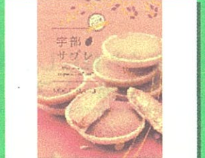
宇部サブレ(虎月堂) 1個 ¥175 他