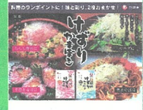
けずり蒲鉾(宇部蒲鉾) ¥540