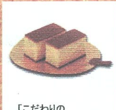
「こだわりの かすてらげってん」 (吹上堂) ¥990