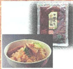
吉部炙り筍ご飯 (楠むらづくり) ¥680